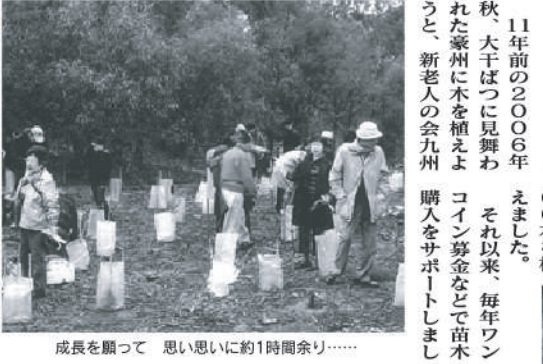
成長を願って 思い思いに約1時間余り…… この日豪交流ではメルボルン、シドニー両市での日野原会長の講演や、シドニーでの「いのちの授業」、在留邦人との多彩な交流会など、新老人の会として大きな成果を残しました。(新老人の会九州支部会報より)

私には日本の森や林に大きな霊園を造ること、日本の緑化を妨げることになると思ひ、賛成できません。成すべきでないアフリカの緑化運動を取り組んだケニアの女性環境活動家ワンガリ・マターサイさんの発想にも似たもので、樹木葬と言ってもよいと思います。生前に苗木を植樹し、亡くなった家族の手で樹木の根元に散骨してもらってもよいのです。