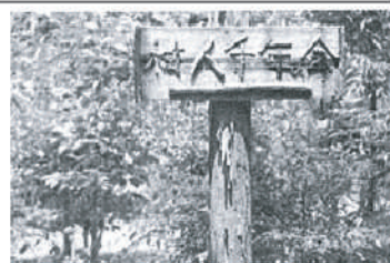
「樹人千年の会」植樹苑現場の看板

新しい墓石はやめて、大きくなる木や花の咲く木を植えて、子孫代々の里山を大切に守っていきことが我々の務めではないか—原会