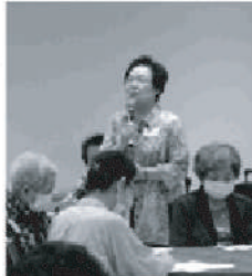
79歳会員の元気の源はダンスと仲間との交流