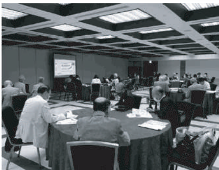
3密を避けて距離をとった席を準備しました

7月12日(日) 天神スカイホールにて今年度初めての例会を開催しました。49名の方が参加され、久しぶりに会う方と、マスク姿でソーシャルディスタンスをとりながら挨拶を交わしておられました。今回は、「難聴がもたらす認知症のリスクと聴覚活用による認知