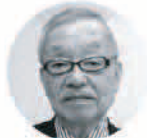
丸山孝一名誉教授

85歳の丸山氏は、 ▽命への関心(生と死・人間の育など)、▽心の問題(喜怒哀楽・価値・善悪の判断など)まで普遍的か・相対的か、人間(パーソンの)の論を展開。