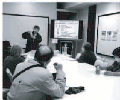
12月5日に博多養生処で開かれた博多いきいき養生勉強会

このように何度も繰り返し返される手のかかる工程に、ペットボトルはキャップとラベルを外して捨てると言われる理由が理解できました。今回も楽しみにしています。