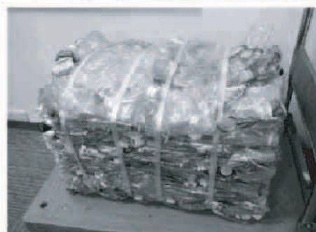
圧縮されたペットボトル。その後、粉碎され純粋なPETに