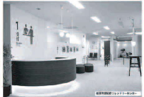
福岡市認知症フレンドリーセンター