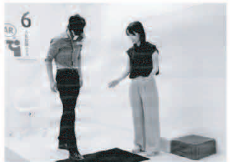
AR(拡張現実)体験コーナー(福岡市HPより)