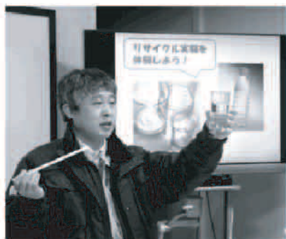
回収ペットボトルについて説明される福岡市環境局職員